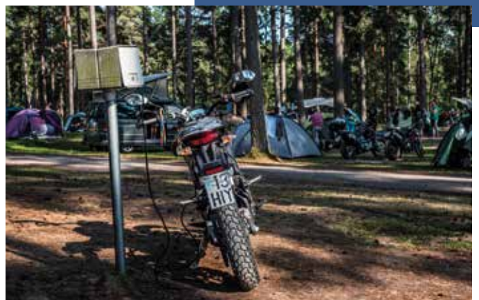
* Dank u wel, telefoon, Kerstman, duivel, rijsttaartjes, Finland

Wat weten we ervan? Sauna, uiteraard. Eind 2017 waren er meer dan 2 miljoen sauna's in Finland voor een bevolking van 5,5 miljoen. Het is het 'land van de duizend meren' – in werkelijkheid zijn het er tussen de 60.000 en 188.000, naargelang de manier van tellen. Gigantisch uitgestrekte bossen hebben ze, beren en wolven inbegrepen. Formule 1-kampioenen en winnende rallyrijders, dat ook. Er is Tove Jansson en haar Moomins, Alvar Aalto, architect, Jean Sibelius, componist, Aki Kaurismäki, filmmaker. En de bekendste Fin, de kerstman of Joulupukki zoals hij daar heet. Nokia, dat de vooruitstrevende technologie van de stille Finnen op de kaart zette. En heb je al gehoord over het Finse onderwijsmodel? Kinderen hebben kortere lesdagen, niemand blijft zitten, en toch komen ze er bij Europese testen als de allerbesten uit. Maar waarom zou je er gaan motorrijden?